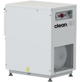
CLR 15/30 CLR 20/30