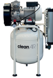
CLR 15/50 CLR 20/50 CLR 25/50