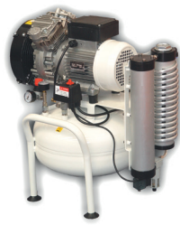
CLR 15/25 CLR 20/25